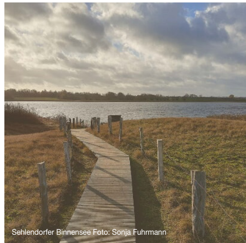
Sehlandorfer Binnensee

Tel.: 0173 8937 040, E-Mail: hinrich.goos@gmx.de